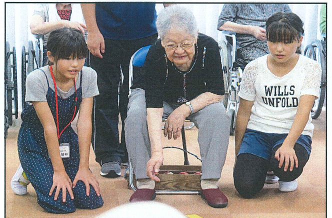
【なぎ園体験の様子】

7月1日～8月31日は、「広がれボランティアの輪」連絡協議会が提唱する「ボランティア体験月間」です。