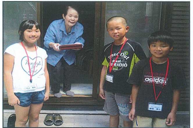
【配食サービス体験の様子】