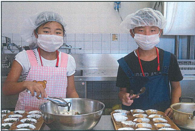
【調理ボランティア体験の様子】

普段経験することができない福祉施設でのボランティア体験や様々な人との出会いや交流を通じて、夏休みの思い出に残る楽しいボランティア活動ができることを期待しています。