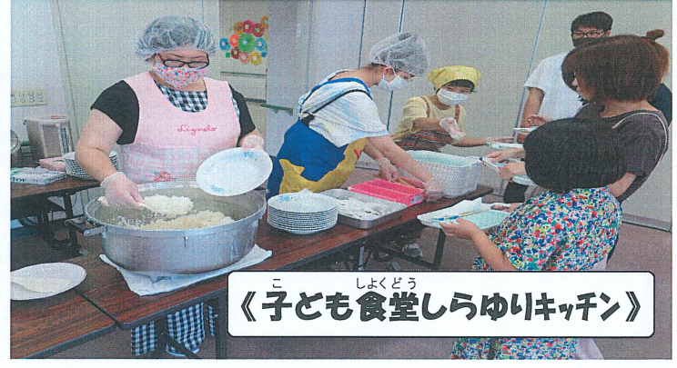
《子ども食堂しらゆりキッチン》

『地域ふれあいサロン』が、参加者の方はもちろんのこと、運営者の方にとっても居場所やつながりの場になっていたら嬉しく思います。そんなふれあいの輪がもっともっと広がることを願っています(^o^)/