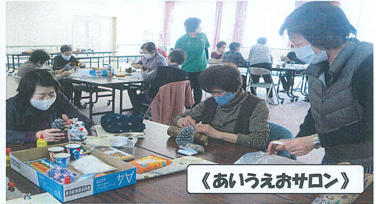
《あいうえおサロン》