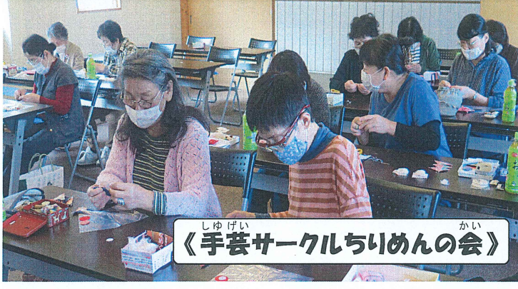
《手芸サークルちりめんの会》