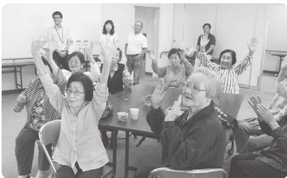
【音楽に合わせて楽しく身体を動かしたよ(^^)】