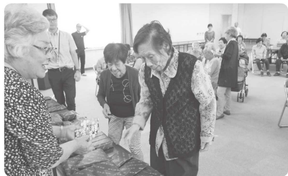
【恒例のビンゴゲーム。良い物あたりますよーに(^^)】