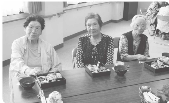
【みんなで食べるとおいしいね～】