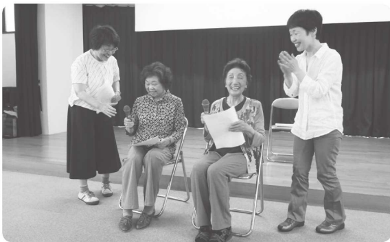
【参加者の皆さんで朗読劇をしました】

自宅に一人閉じこもることなく、みんなで楽しく食事やゲームをし、そうした時間をともに過ごす中でつながりがうまれたら、との思いで開催しています。