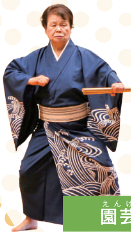
えんげいか 園芸科