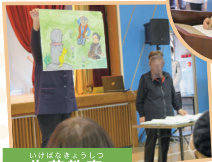
いけばなきょうしつ 生花教室