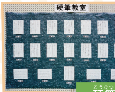
こうひつきょうしつ 硬筆教室