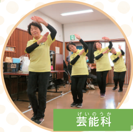
げいのうか 芸能科