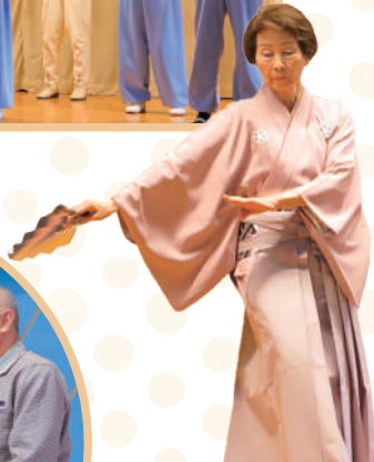
もうひつきょうしつ 毛筆教室