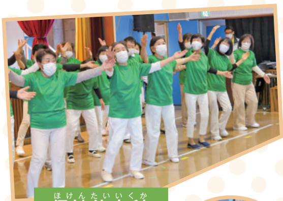
ほけんたいいくか 保健体育科

11月26日(金)、「老人大学各科・教室発表会」を行いました。 学生のみなさんは、それぞれの教室で日頃学んでいる特徴をいかして、 元気いっぱい発表してくれました！