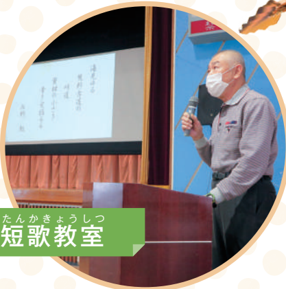
たんかきょうしつ 短歌教室