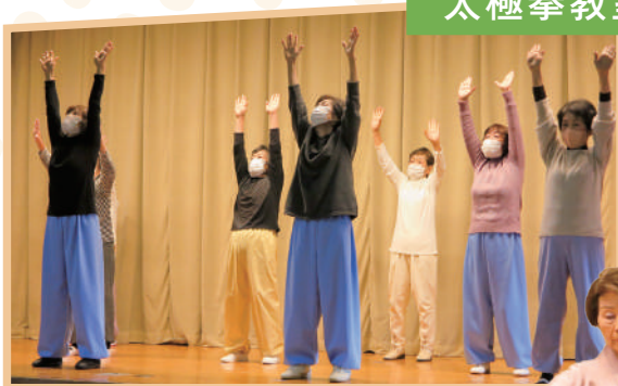
たいきょくけんきょうしつ 太極拳教室