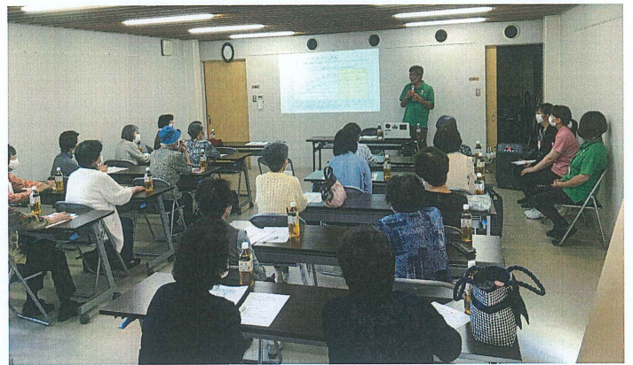
天神山老人クラブのみなさん(9月26日)