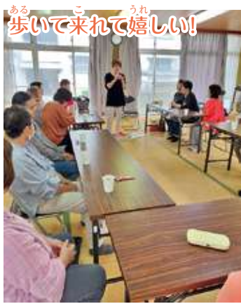
あるこ歩いて来れて嬉しい!

新たなサロンが誕生したことで、出会いやつながりが生まれ、身近な地域での支え合いが広がってくれる事を願います。