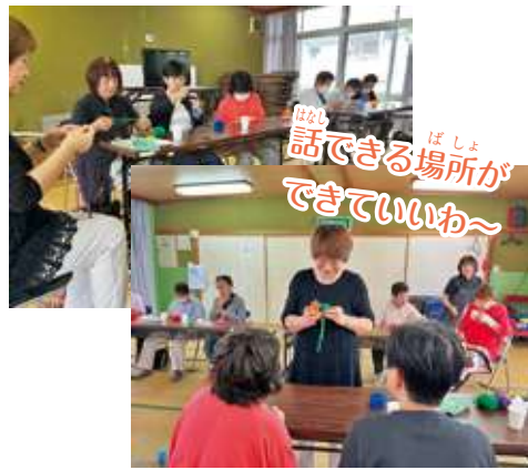
話できる場所ができていいわ~