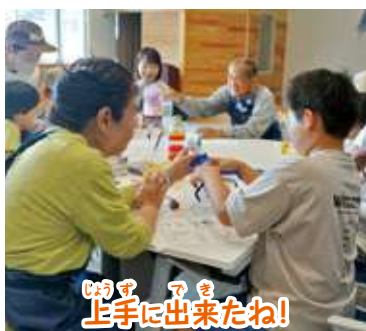
じやうず 上手に出来たね!