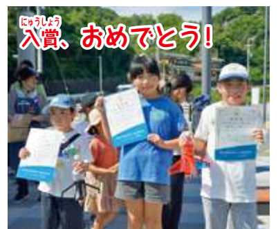
じやうしやう 入賞、おめでとう!

おもちゃ病院開院日は、毎月の予定(広報紙)に掲載しています。【お問合せ】湯浅町社会福祉協議会(担当: 谷口)