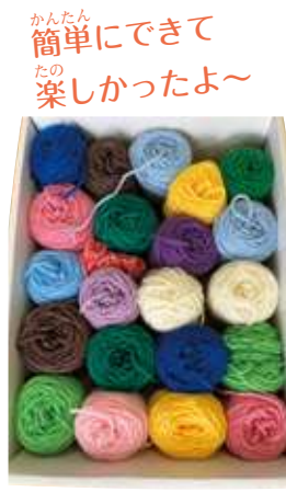
かんたん簡単にできてたの楽しかったよ~